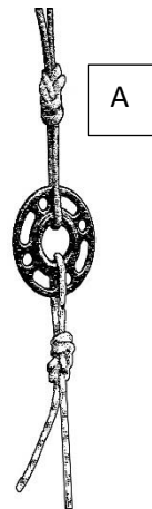
Figure 2. Stationnaire simple : Une seule corde attachée à l'aide d'un nœud en 8 simple dans une configuration de corde stationnaire.